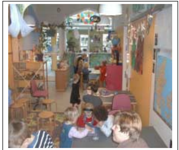
Leikskólinn Galaxen í Danmörku

Þau eiga að geta notað það sama aftur og aftur á nýjan og nýjan hátt en ekki þurfa ný og ný leikföng.