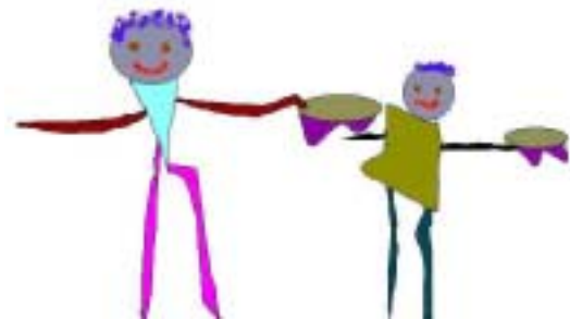
Mynd úr verkefni Konnýrar Hákonardóttir

Hér læt ég lokið þessum litla pistli – sem flest ykkar hafa líka heyrt. Gaman væri að fá viðbrögð ykkar sem síðan er hægt að senda inn í næsta fréttabréf